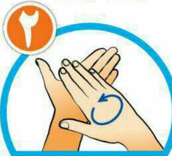
کف دست‌ها را با هم بشویید.