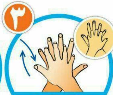
بین انگشتان را در قسمت پشت بشویید.