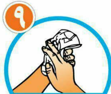
دست‌ها را با دستمال خشک کنید.