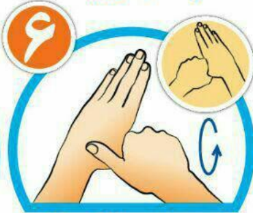
شست‌ها را جداگانه و دقیق بشویید.