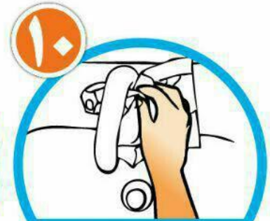
با همان دستمال شیر آب را ببندید و دستمال را در سطل زباله بیاندازید.