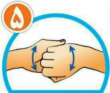
نوک انگشتان را در هم گره کرده و به خوبی بشویید.