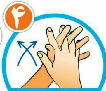
بین انگشتان را از روبرو بشویید.