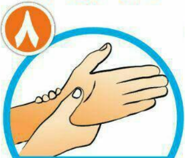
دور مچ هر دو دست را بشویید.